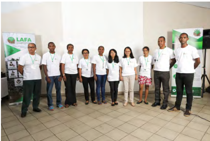
L'équipe de coordination du Forum Lafa